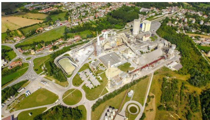
Usine Eciom Lumbres

(Nouvelles ressources pédagogiques + visite de cimenterie)